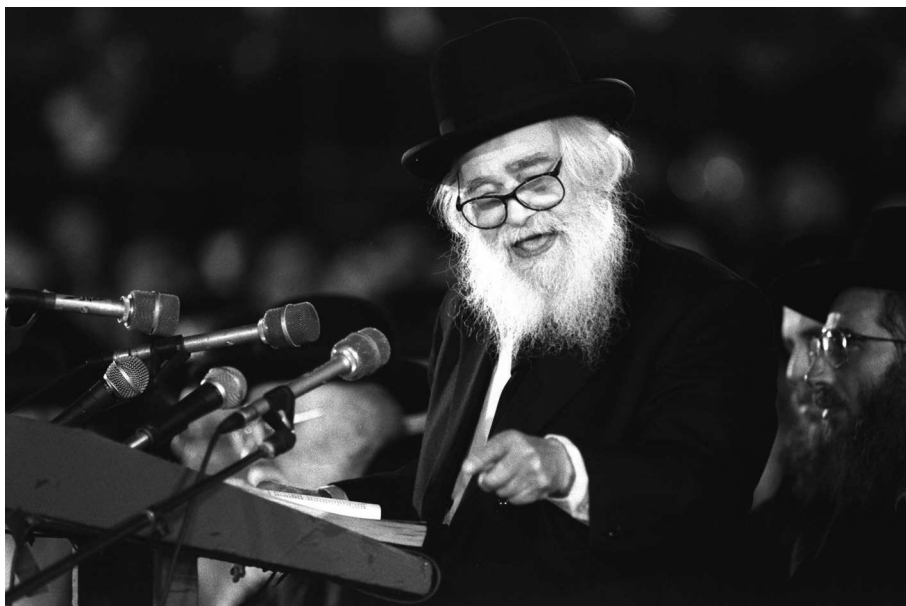
הרב שך בכנס 'דגל התורה' באצטדיון יד אליהו, 28 במרס 1990 ('נאום השפנים'). צביקה ישראלי

שנות החמישים ל'מועצת גדולי התורה' של אגודת ישראל. ואולם הוא עלה למרכז הבמה החרדית הציבורית רק בתחילת שנות השבעים, כאשר כבר היה למעלה מבן 70 שנה. משעה שעלה – הוא הפך להיות 'גדול הדור' הבולט ביותר בזמנו, ולמעשה הבולט והמשפיע ביותר בחברה החרדית בכלל עד היום.