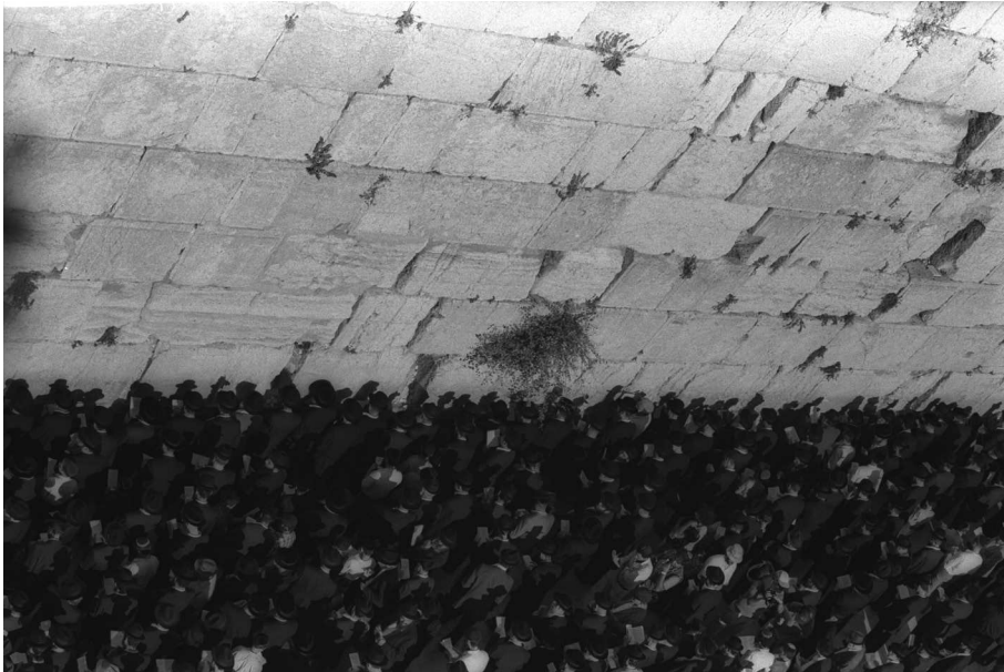
הפגנה ברחבת הכותל נגד פתיחת בתי קולנוע בשבת בירושלים, 24 באוגוסט 1987.