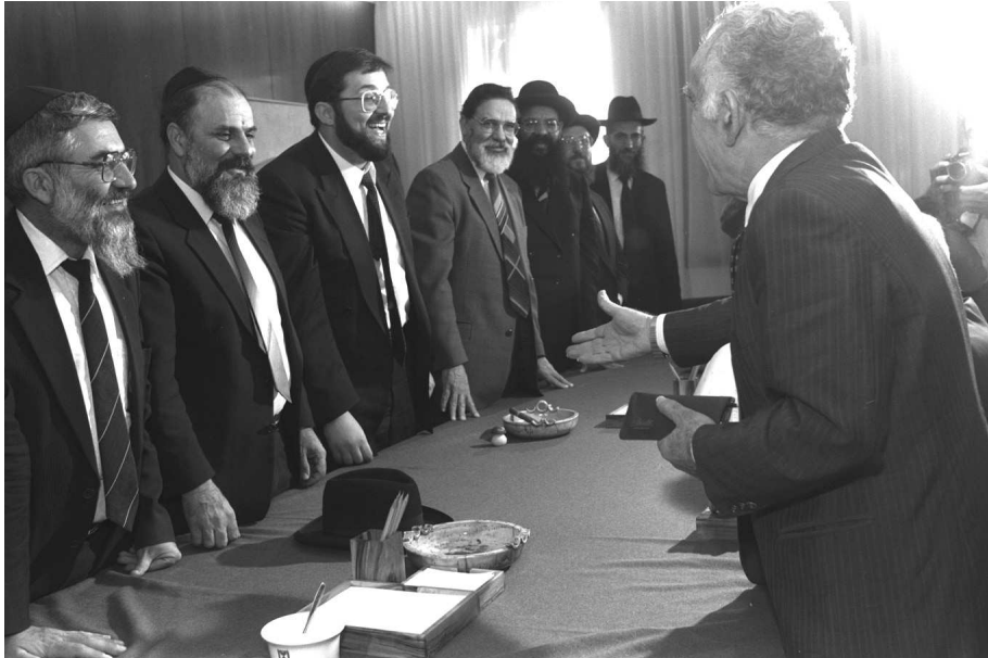
רה"מ יצחק שמיר בפגשה עם חברי ש"ס משמאל: רפאל פנחסי, יצחק פרץ, אריה דרעי ועוד, 2 בנובמבר 1988. חגי איילון